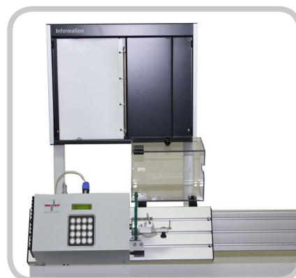
Infotafel und Litzen - Niederhalter